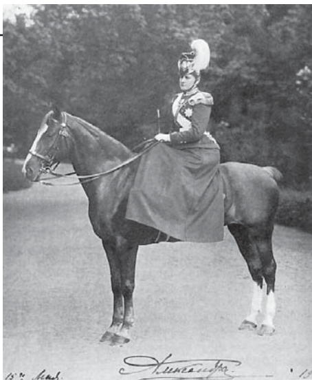
Императрица Александра Федоровна в форме Лейб-Гвардии Уланского полка 15 мая 1903 г.

В 1809 году (помните? — именно в этом году полк был причислен к гвардии) полк был снова реформирован, на его базе был создан еще и Драгунский полк (император Александр I желал таким образом усилить гвардейскую кавалерию), который сразу же получил назначение в Петергоф. С этим полком, впоследствии