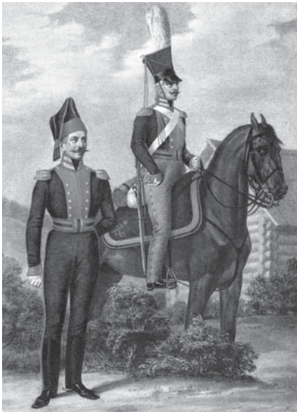
Рядовые Уланского Ея Высочества Цесаревича Константина Павловича полка, 1803-1806 гг

...Именно по желанию будущего Великого князя и был создан первый в России регулярный Уланский полк,