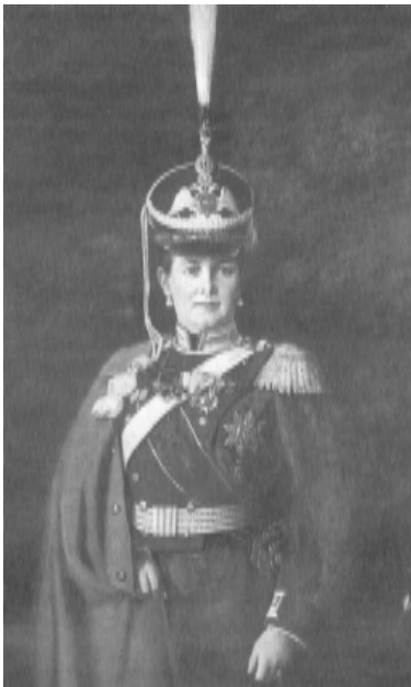
Великая Княгиня Мария Павловна в парадной форме Лейб-гвардии Драгунского полка, 1912 г.

Назимов, отбиваясь саблей от группы черкесов, изрубил несколько человек, прежде чем сам был застрелен вместе с еще двумя офицерами.