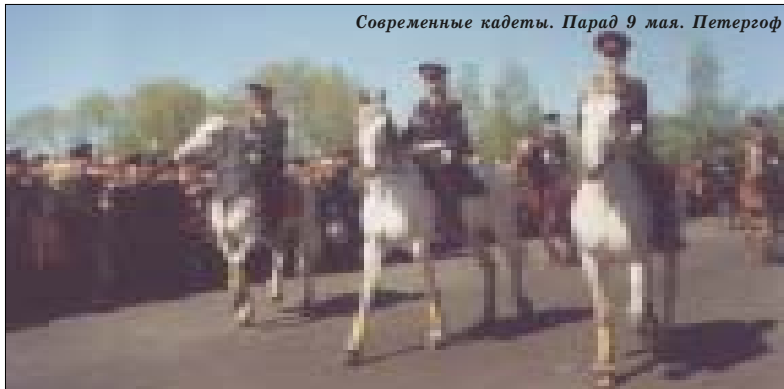
Современные кадеты. Парад 9 мая. Петергоф

Что же, препояшем чресла — и в путь, в путь, мои дорогие, по дорогам и тропам российской истории!