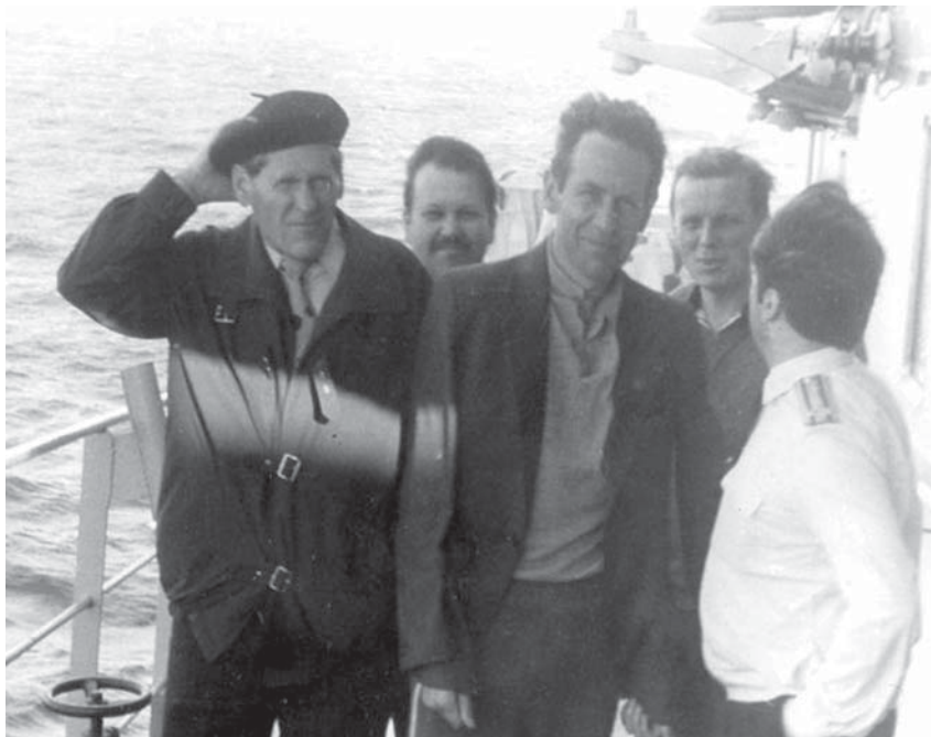
На военных испытаниях. 1980 г.